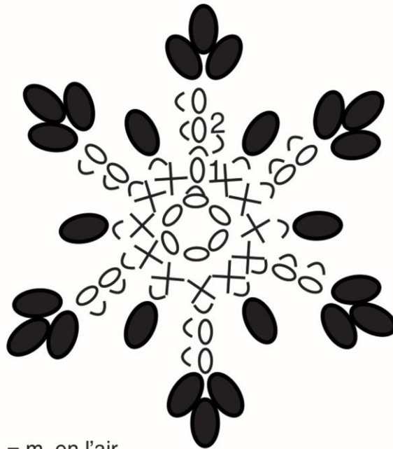
Diagramme d'un flocon

Avec la qualité PHIL DOUCE, faire 7 pts lancés sur ch. face (voir photo).